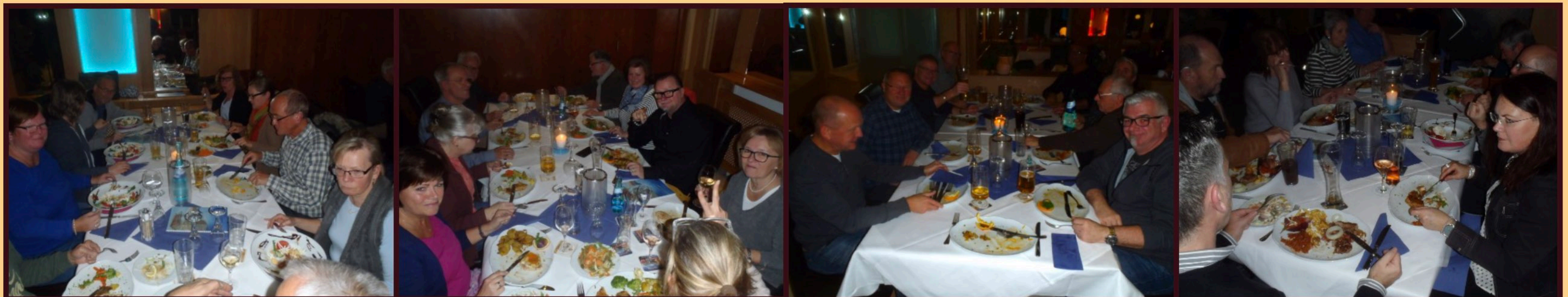
Nach Beendigung der Hauptversammlung der Versammlung haben die Mitglieder einen guten Appetit auf das Essen.